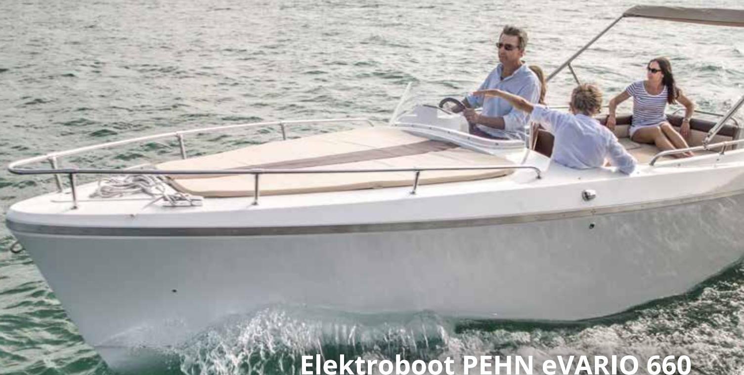
Elektroboot PEHN eVARIO 660